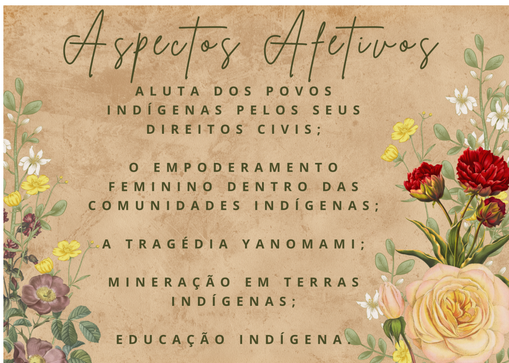
Figura 1: Aspectos afetivos presentes nos elementos interativos

Como cita o artigo os aspectos afetivos, as emoções são ações e compõem o aprender, nesse intuito o produto educacional elaborado aborda a afetividade no contexto em que será embasado, sendo a cultura indígena uma temática social, que pode despertar distintas emoções ao estudar esse tema. Na tabela interativa será possível analisar diferentes abordagens referente a parte cultural, abaixo veja figura com alguns dos principais aspectos afetivos presentes no produto educacional: