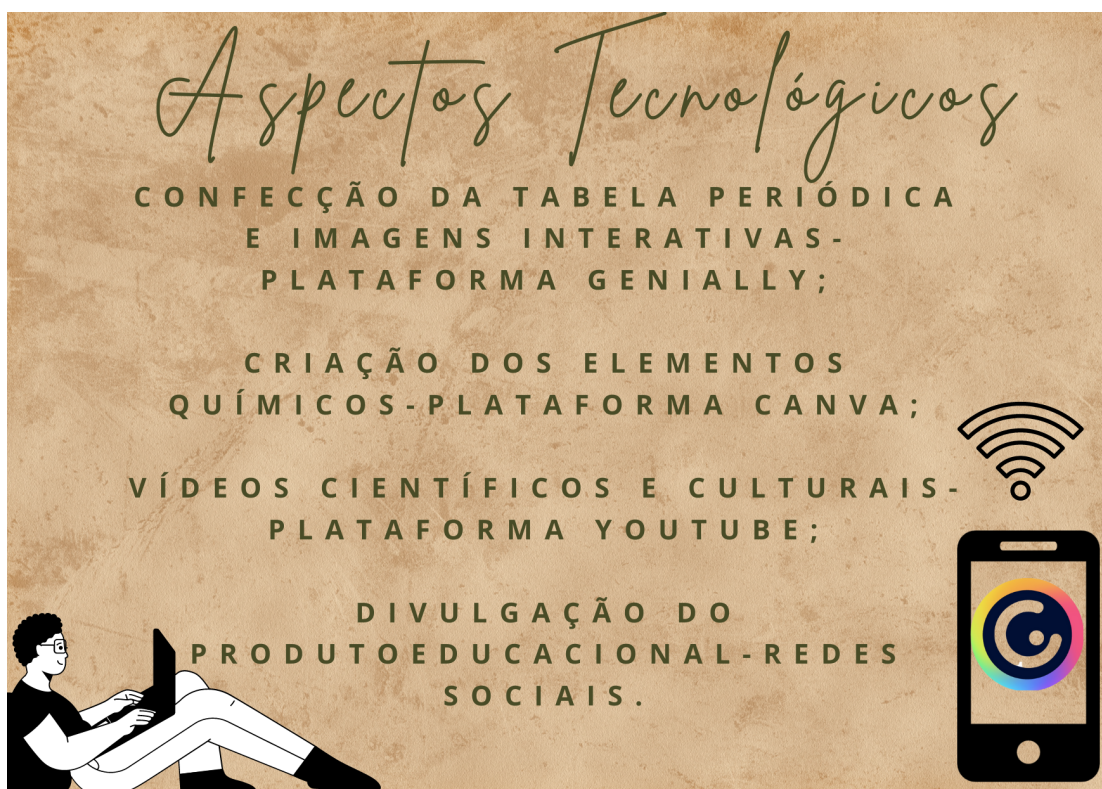
Figura 3: Aspectos tecnológicos presentes na construção da tabela interativa

Esse é um dos aspectos mais visíveis presente no produto educacional, no qual é confeccionado inteiramente digital, em que sua principal forma de apresentação é através da plataforma digital Genially . A seguir veja na figura abaixo como esses aspectos tornam-se fundamentais para a construção e idealização deste material: