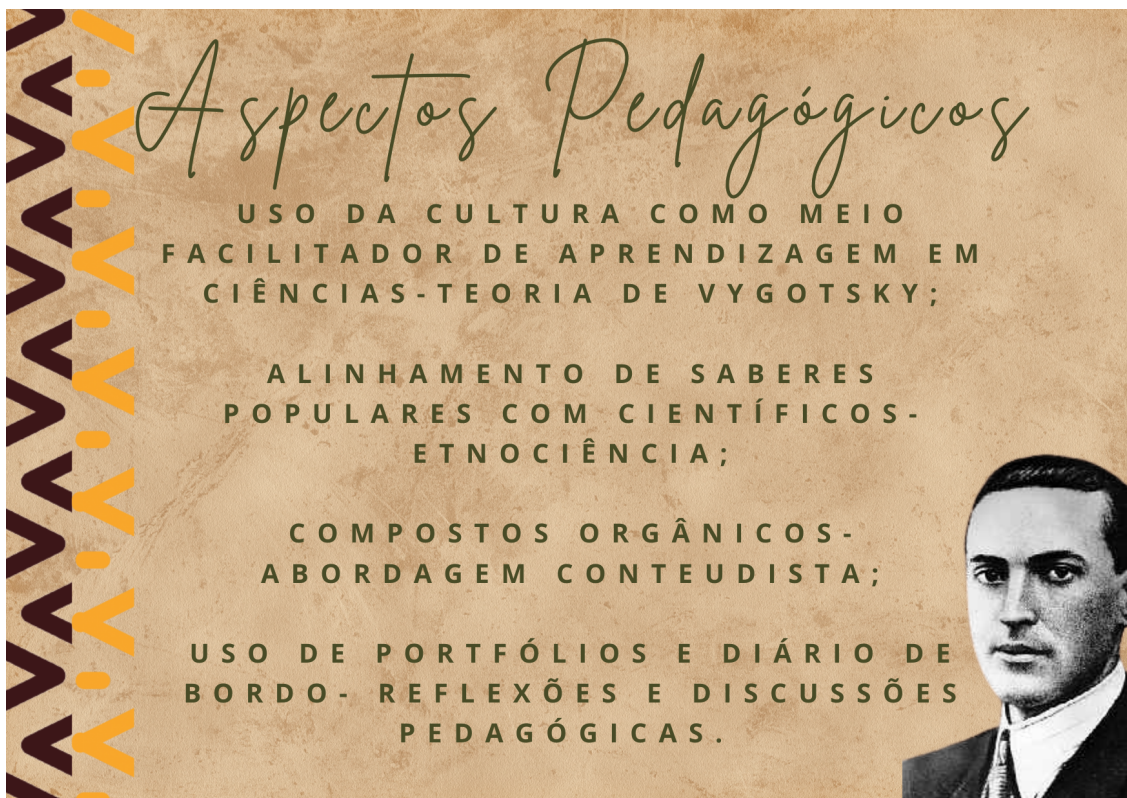
Figura 4: Aspectos pedagógicos presentes na tabela interativa

Para finalizar a identificação dos aspectos fundamentais para um produto educacional voltado ao ensino, torna-se necessário que todos os aspectos anteriores culminou na intenção de desenvolver um material que instigue e construa aprendizagem, no intuito de essa ferramenta ser utilizada como um auxílio de saberes científicos em determinada área de ensino e que promova a discussão e argumentação crítica ao abordar uma temática social. Abaixo veja na figura quais os aspectos pedagógicos que servirão para estimular a aprendizagem em ciências: