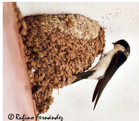
Avión ( Delichon urbica ) en su nido

Otra diferencia respecto a la golondrina es su nido, totalmente cerrado excepto una pequeña abertura. En su interior ponen de dos a cinco huevos blancos que empollan durante quince días.