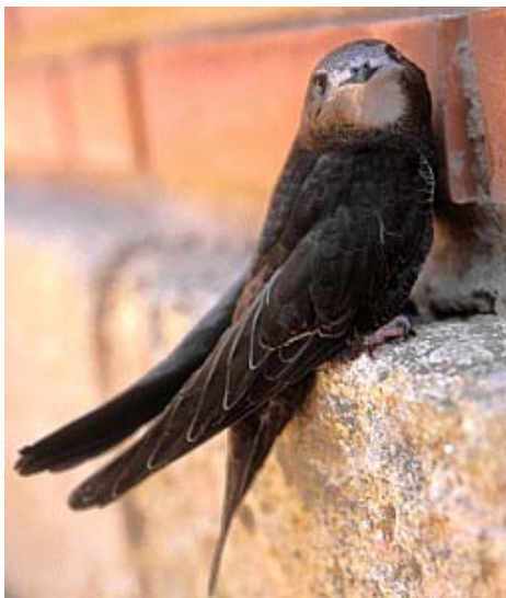
Vencejo ( Opus opus )

Ave de plumaje negro, excepto la barba blanquecina. Su nombre en valenciano “falsià” o “falciot” de debe a la forma de sus alas, alargadas y finas como una hoz. Se puede escuchar como las alas del vencejo cortan el viento. Entre el macho y la hembra, que se unen, por cierto de por vida, no se aprecia ninguna diferencia externa de tamaño o plumaje (esto es lo que lo ornitólogos denominan “dimorfismo sexual”).