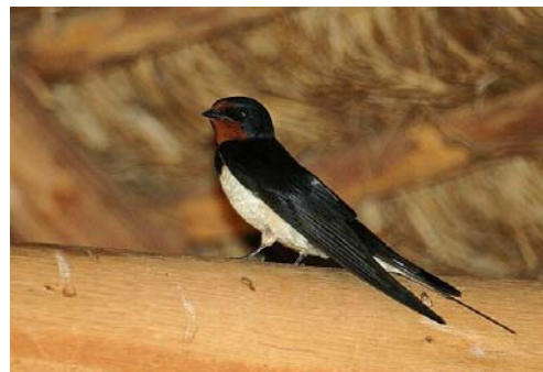
Golondrina ( Hirundo rustica )

Su cola en forma de 'V', más larga en el macho que en la hembra y su garganta roja con una franja azul es inconfundible. Su parte ventral es de un color blanco nacarado, mientras su espalda muestra un precioso azul metálico.