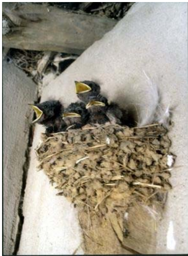
Nido y crías de golondrina ( Hirundo rustica )

En el mes de abril siempre vuelven las fieles parejas al lugar exacto donde nacieron y criaron el año anterior. Allí restauran o construyen de nuevo un nido en forma de cazuela, utilizando barro, saliva y un poco de paja. El interior queda cubierto de plumas y pelo, allí nacerán cuatro o cinco polluelos después de quince días de incubación.